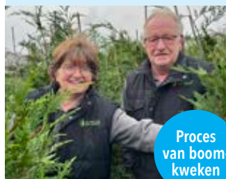
Proces van boomkweken