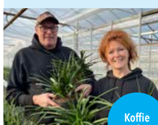
Koffie en thee